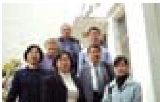
與尖山教會的牧者合影