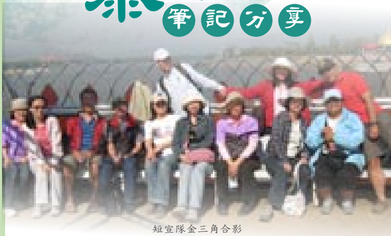
短宣隊金三角合影