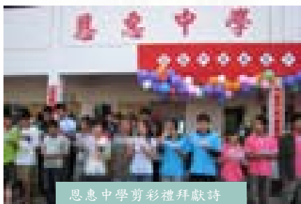
恩惠中學剪彩禮拜獻詩

的伯特利聖道學院。該校造就來自中國、緬甸、寮國和泰國的神學生，這些傳道人畢業後回到祖國，繼續將真道傳給他們的同胞。