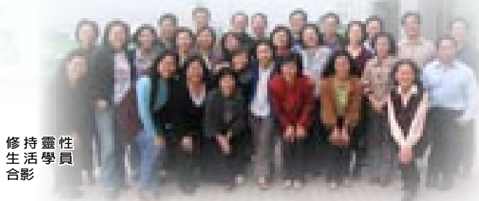
修持靈性 生活學員 合影

傳福音的腳蹤不能止歇，神大使命的託付不容忽視。不論得時不得時，總要傳福音。正如保羅所說：「因為從頭一天直到如今，你們是同心合意的興旺福音。我深信那在你們心裡動了善工的，必成全這工，直到耶穌基督的日子」（腓1:5-6）。願被擄的得釋放，被囚的出監牢，願耶穌基督醫好一切傷心的人，願我們一同向萬民報告——主耶穌是彌賽亞的大好信息。