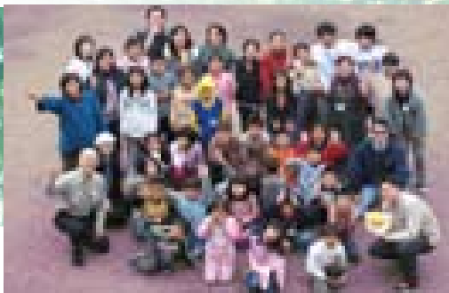
中崙國小歡樂營合照